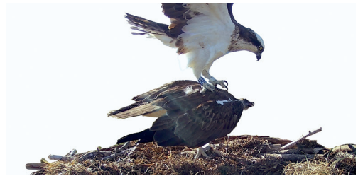
Tentative d'accouplement par Olympe avec la femelle. Grande Cariçaie, 3 mai 2023.