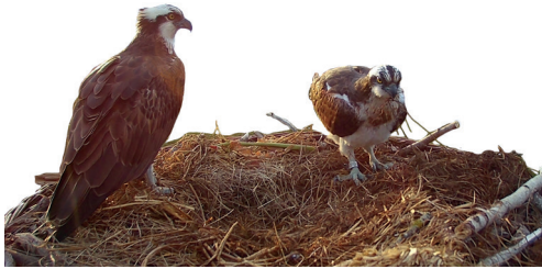
Balibuzard Pandion haliaetus observant le mâle intrus déplaçant des brindilles. Grande Cariçaie, 1 er mai 2023.