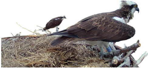
Première apparition de la femelle non baguée. Grande Cariçaie, 20 avril 2023.