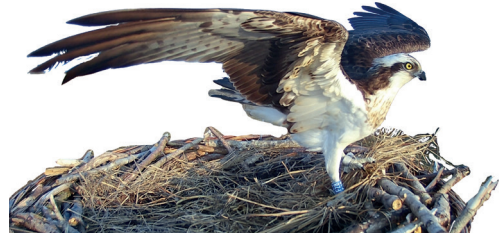
Olympe s'active beaucoup à la recharge. Grande Cariçaie, 9 avril 2023.