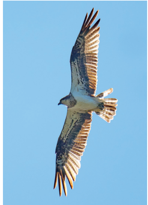
Balbuzard Pandion haliaetus femelle non baguée estivante dans le bassin du Drugeon. Doubs F, 23 juillet 2023.

Taurus PS7 (2017). Alors qu'il avait été régulièrement vu à Bellechasse en 2022 (souvent en compagnie de Racine F29 de fin juillet à fin août), sa présence n'a pas pu être établie en 2023 dans la région des Trois-Lacs. Ni les Matinées Balbuzards des 4 et 25 juin, ni les pièges photo n'ont permis de le détecter. Il semble peu probable que Taurus ait pu passer inaperçu, et on peut craindre qu'il ne soit pas revenu suite à un accident en migration ou en hivernage.