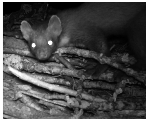
Martre Martes martes sur une des plateformes d' Olympe . Grande Carrière, 25 août 2023.

Mouche PR4 (2016). En Moselle F, Mouche PR4 s'est reproduite en 2023 pour la quatrième année de suite sur le même nid avec le même mâle (bague AM06). Bien que toujours plus vermoulu, l'arbre porteur de l'aire a une fois encore bien résisté. À toutes fins utiles, une plateforme de réserve a quand même été