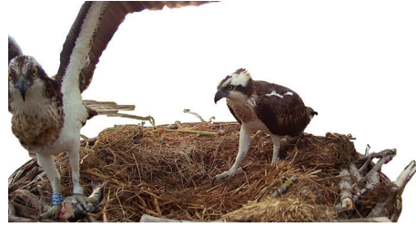
Balibuzard Pandion haliaetus femelle regardant avec intérêt une proie apportée par Olympe. Grande Cariçaie, 25 avril 2023.