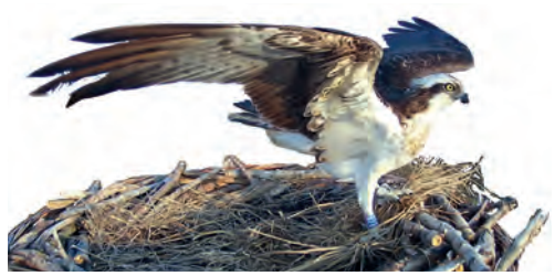
Olympe s'active beaucoup à la recharge. Grande Cariçaie, 9 avril 2023.