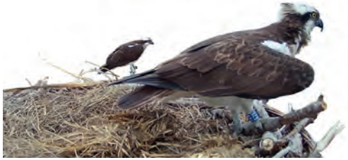
Première apparition de la femelle non baguée. Grande Cariçaie, 20 avril 2023.