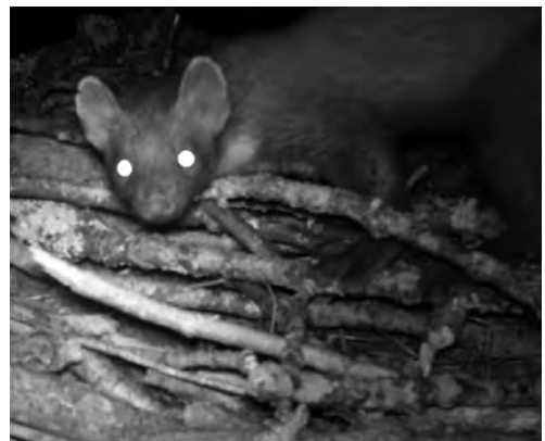
Martre Martes martes sur une des plateformes d' Olympe . Grande Caricaie, 25 août 2023.

Mouche PR4 (2016). En Moselle F, Mouche PR4 s'est reproduite en 2023 pour la quatrième année de suite sur le même nid avec le même mâle (bagué AM06). Bien que toujours plus vermoulu, l'arbre porteur de l'aire a une fois encore bien résisté. À toutes fins utiles, une plateforme de réserve a quand même été