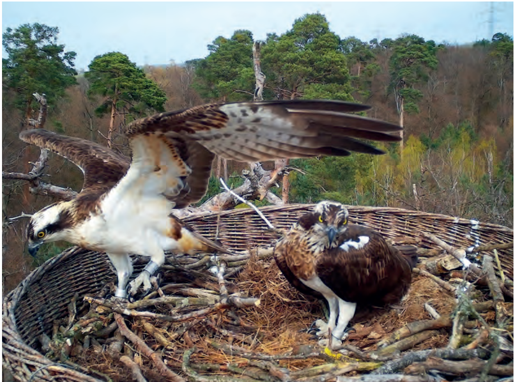
Début d'installation du 1 er couple depuis 1907 sur la rive allemande de Rhin ( Chronos à droite). 6 avril 2023.

ou en France voisine (sans voir si l'oiseau était bague) dans la période s'étendant du 1 er juin au 25 juillet, donc hors d'une migration pré-nuptiale tardive ou d'un passage post-nuptial précoce. Il est donc difficile d'interpréter le statut de ces individus « flottants », dont les apparitions restent d'habitude aussi ponctuelles qu'éphémères. Le plus probable est qu'il s'agisse d'immaturs de 2 ou 3 ans, âge auquel un Balbuzard peut vagabonder pendant une sorte « d'année sabbatique ». Des observations le 1 er juin au delta du Rhin BW (D. Bruderer), les 3 (B. Christen) et 7 juin (D. Eichhorn) à Loèche VS, le 13 juin à Cartigny GE ( via G. Dändliker), puis le 16 juin à Sempach LU (N. Aregger) et à Rottenschwil AG (S. Leutwyler) se rapportent probablement à de tels individus en erratisme. Un mâle immature a par ailleurs séjourné le long de l'Inn dans les Grisons jusqu'au 24 juin (Th. Wehrli, etc.), peut-être l'oiseau noté ensuite le 29 juin à Sarnen OW (H. Kneubühler, W. Hilfiker), le 4 juillet à Alpnach OW (M. Brun), le 6 à Unterseen BE (M. Zahnd), voire éventuellement aussi le 11 à Köniz BE (J. Meric).