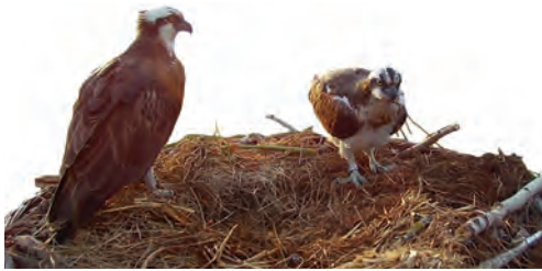
Balibuzard Pandion haliaetus observant le mâle intrus déplaçant des brindilles. Grande Cariçaie, 1 er mai 2023.