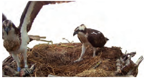
Balibuzard Pandion haliaetus femelle regardant avec intérêt une proie apportée par Olympe. Grande Cariçaie, 25 avril 2023.