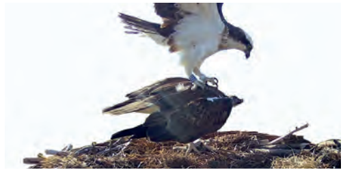
Tentative d'accouplement par Olympe avec la femelle. Grande Cariçaie, 3 mai 2023.